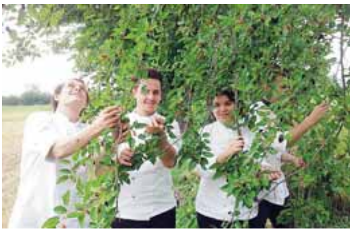
In alto un disegno del gelso di Milani, sopra cuochi che colgono more

po' come studiare lo scheletro per dipingere la figura umana).