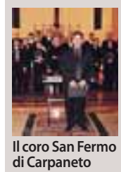
Il coro San Fermo di Carpaneto

Il coro Montenero sarà protagonista anche la prossima settimana nell'ambito della rassegna provinciale dei cori piacentini. Una delle tre serate si terrà infatti anche a Pontedelloio, sabato 28 giugno, alle 21 nella chiesa di San Giacomo, in cui saranno ospiti il Coro Folk di Fiorenzuola, la Corale Città di Fiorenzuola, il Coro CAI Piacenza.